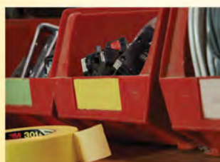
Perfecto para el etiquetado