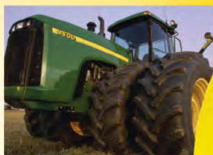
Perfecto delineado de pintura